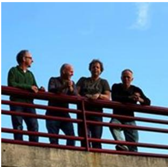
Om de Hoek

Verder hebben we erg kunnen genieten van de optredens van de Zwolse band Om de Hoek en van de Shantycrowd Buitenboord.